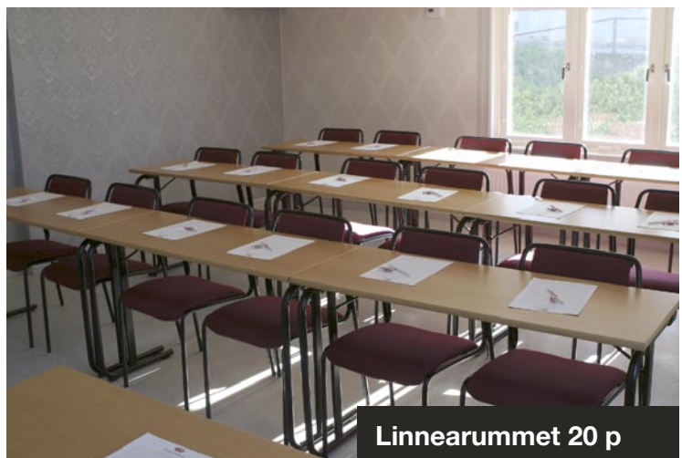
Linnearummet 20 p