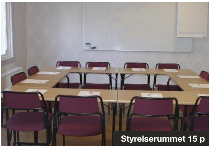
Styrelserummet 15 p