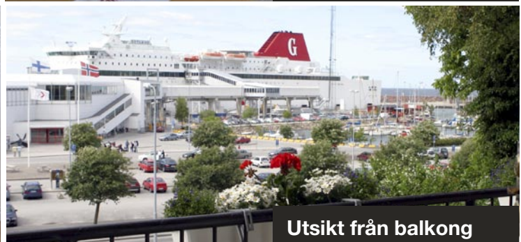
Utsikt från balkong